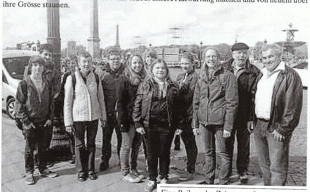
Eine Beilage der Zeitung «reformiert.»

Die Grösse dieser Millionenstadt hat uns in ihren Bann gezogen. Dieser wird uns nicht wieder loslassen, bis wir der Stadt an der Seine erneut unsere Aufwartung machen und von neuem über ihre Grösse staunen.