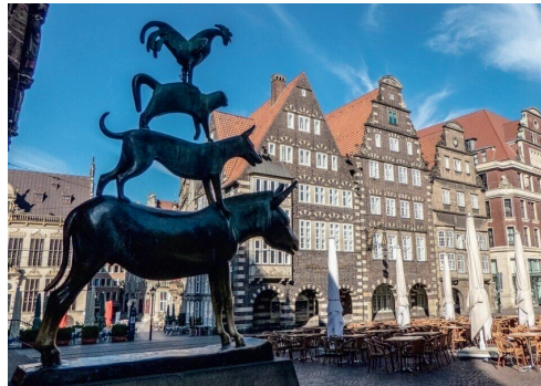
Bronzeguss vor dem Bremer Rathaus

Paulus in seinem Brief an die Römer 1,12