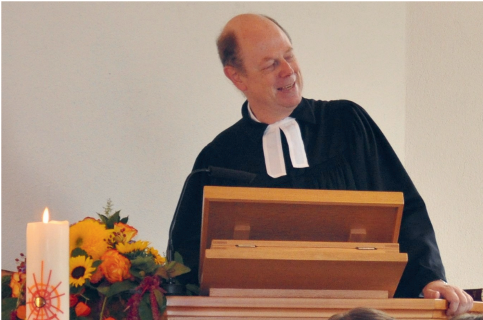
Foto aus dem Archiv, Jubiläumsgottesdienst 2017