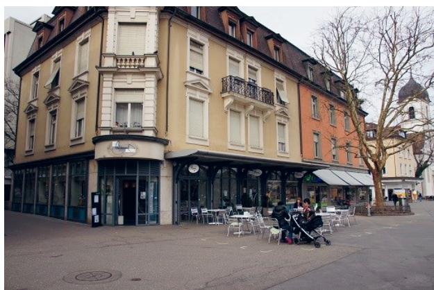
Der «Himmel» in Baden (mit der reformierten Kirche im Hintergrund)

Ist es Zufall, dass wir, meine Frau und ich, so ziemlich in der Mitte zwischen Himmel und Teufelskeller zu wohnen kommen? Zwar ist dieser Himmel «nur» eine Confiserie und der Teufelskeller «nur» eine geologisch interessantes Waldstück am Baregg. Aber immerhin!