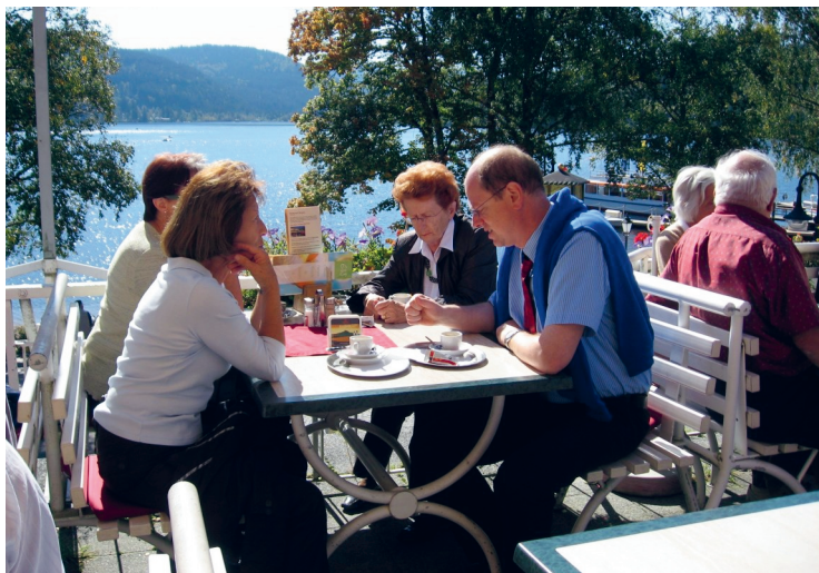
Foto aus dem Archiv, Seniorenreise 2007